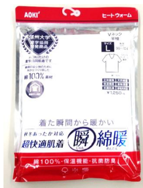
「超快適肌着 瞬綿暖®」パッケージ