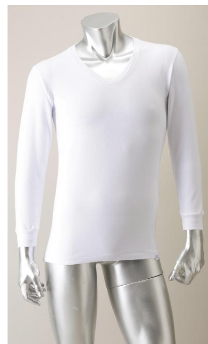
「超快適肌着 瞬 綿暖®」Vネック九分袖