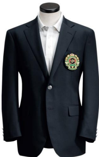
AOKI「JGA公認 チャンピオンブレザー レプリカモデル」

AOKIでは、これまで上記のナショナルオープン3大会に特別協賛するとともに、その名誉あるブレザーをすべて提供しています。