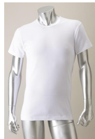
究極デオドラント“瞬”綿暖 ® 半袖