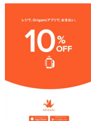
キャンペーン告知POP