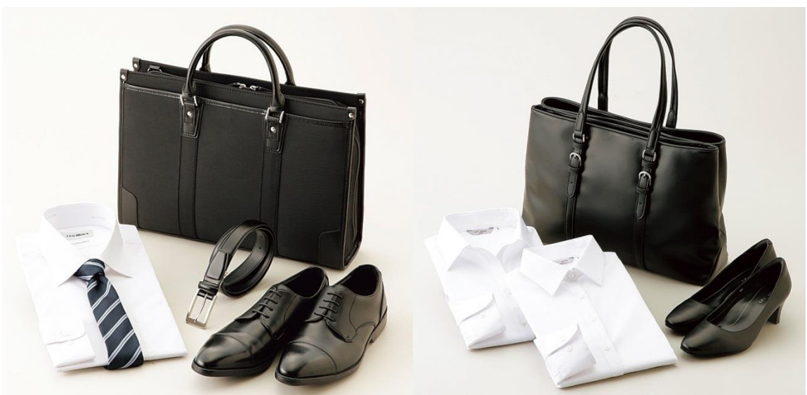
AOKI&マイナビスチューデント(現『マイナビ学生の窓口』)共同開発 「究極の就活シリーズ」

【左:メンズアイテム】シャツ、ネクタイ、ベルト、シューズ、バッグ 【右:レディースアイテム】ブラウス、パンプス、バッグ