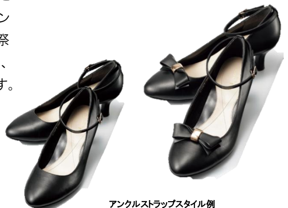
アングルストラップスタイル例