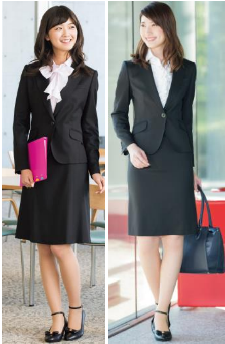
CanCamコラボセットアップスーツ