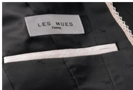
ジャケットの内仕様のデザイン レースパイピング&リボンジャガード裏地 ※商品により、色は異なります。