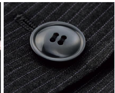
ジャケットのフロントボタン ぷっくりとした丸ボタンでさりげない可愛らしさ