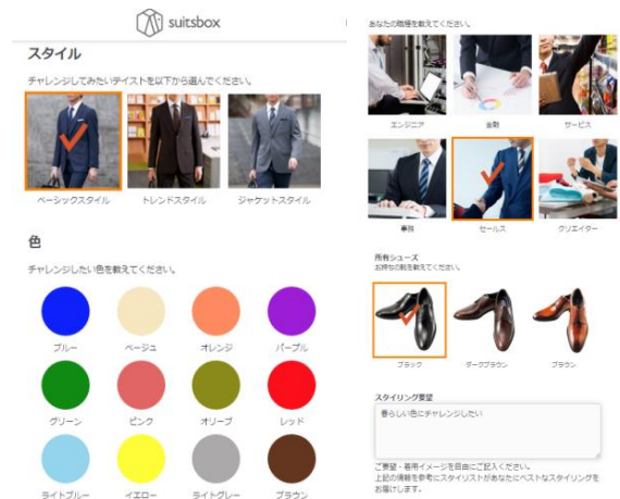
suitsboxユーザー登録画面イメージ

「身長・ウエスト・股下・首周り・袖丈」の該当サイズを入力。 チャレンジしてみたいテイスを選択し、チャレンジしたい色、 仕事のスタイル、お持ちの靴のカラーを入力するだけ。 その他スタイリングの要望はフリー欄に自由に伝える事が可能。