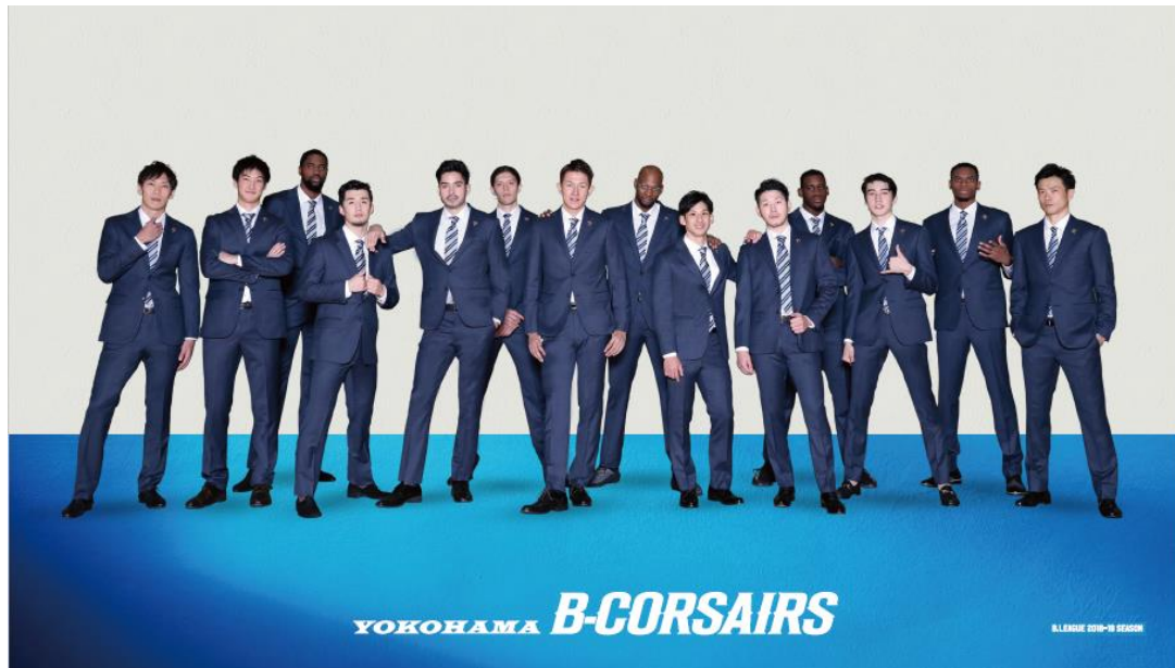
横浜ビー・コルセアーズ 2018-19オフィシャルスーツ