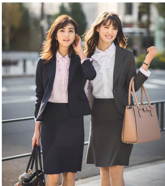
CanCamコラボセットアップスーツ

株式会社AOKI(代表取締役社長:諏訪健治)は、女性ファッション誌『CanCam』(小学館発行)との共同開発第9弾となるコラボレーション商品を、2018年12月27日(木)より、AOKI全店舗およびオンラインショップ( https://www.aoki-style.com/index/ladies )にて発売します。(2018年12月27日現在 AOKI店舗数573店舗)