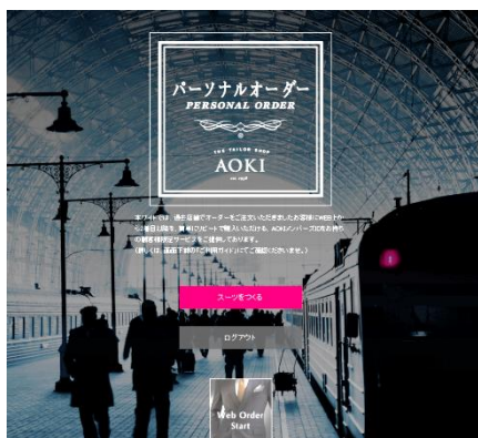
AOKIパーソナルオーダースーツ ECサイトイメージ

今後も、AOKI独自のスタイリスト接客でジャストサイズを実感いただけるAOKIのパーソナルオーダースーツを、場所や時間を選ばず好きな時間に作ることができる楽しさを体験いただけるようサービスをご提供してまいります。