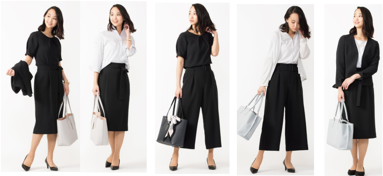
トリアセセットアップ コーディネート例

この夏は、会議や商談のスーツスタイルから、オフィスワークのビジカジスタイルに至るまで様々なシーンに応じたコーディネートができるセットアップアイテムの企画開発を強化。単品使いが可能なジャケット・パンツ・スカート・カットソーの4アイテムで、とことん着回しを楽しんでいただけます。AOKI全店ならびにAOKI公式オンラインショップ( https://www.aoki-style.com/static/casual_suit/ )にて新発売いたします。