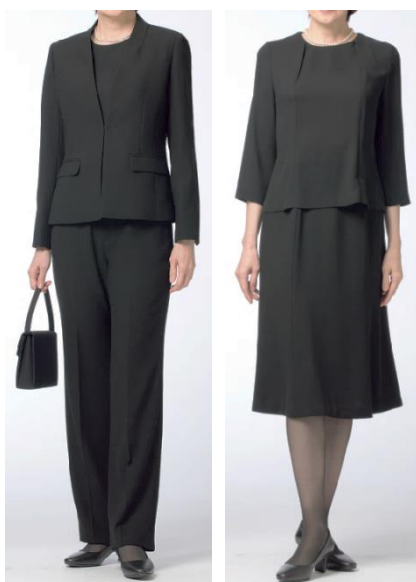
ウォッシュアップフォーマル スタイリング一例

本新商品は、単品でもセットアップでも着用できるように、同生地「ジャケット・ボトム」が別々のサイズで購入することができます。ボトムはパンツ・スカートの2種類から選択することができるため、お客様お一人お一人のお好きなスタイルにお応えすることが可能となりました。