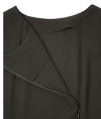
前開きファスナーイメージ