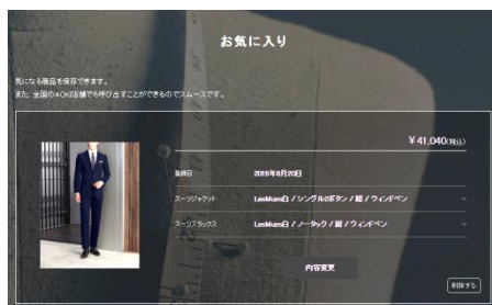
AOKIパーソナルオーダースーツ ECサイトイメージ

また、全てのお客様にパーソナルオーダースーツに触れていただきたいという思いから、サイト内にはビジネスやブライダルシーンなど、用途に合わせたスタイリングの訴求ページを新設。お客様ご自身でベースとなるスタイルを選択して、生地やオプションを自由にカスタマイズ・シミュレーション表示ができるため、場所を選ばずオーダースーツならではの「自分だけの1着」をつくる楽しさを体験いただけます。