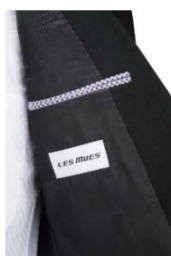
別注カラー：パープル