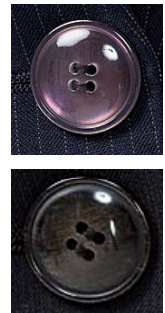
透明感のあるぷっくりボタン (上:紺、下:黒)