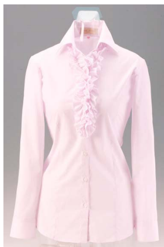
フリル取り外し時