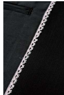
完全別注のラメ混レースパイピング (黒)