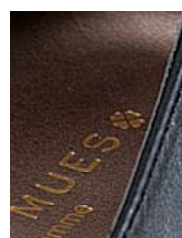
クローバーのワンポイント