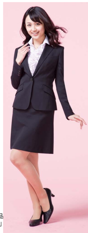
AOKI×CanCam コラボ商品 「フォーチュンハートスーツ」 (黒 織柄)

AOKIでは、今後も付加価値の高い商品の開発を継続し、お客さまのご満足を提供してまいります。