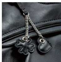
ハートとクローバーの Wチャーム