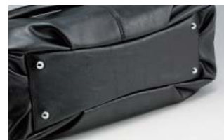
安定感アップの底鉄付き