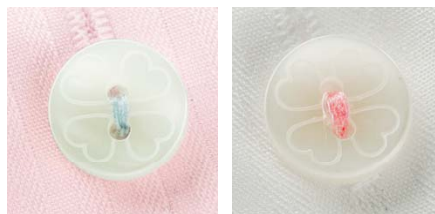
クローバーにアクセントを添える留め糸