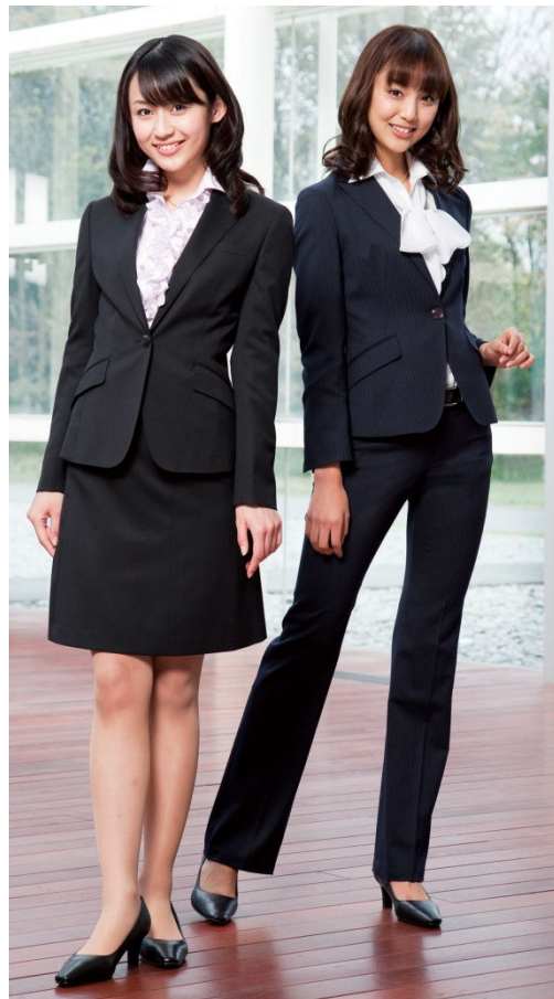
AOKI×CanCam「フォーチュンハートスーツ」