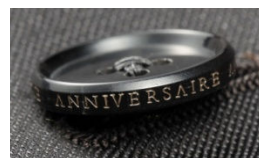
「ANNIVERSAIRE」のロゴ刻印入りボタン