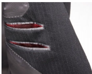
「アニヴェルセル」のアイデンティティともいえる赤いアクセントカラー

サイズ :Y体・A体・AB体・BB体 各4～7号 価格 :108,000円、128,000円 ※税込。以降、価格はすべて税込。