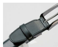
(アジャスター部分)