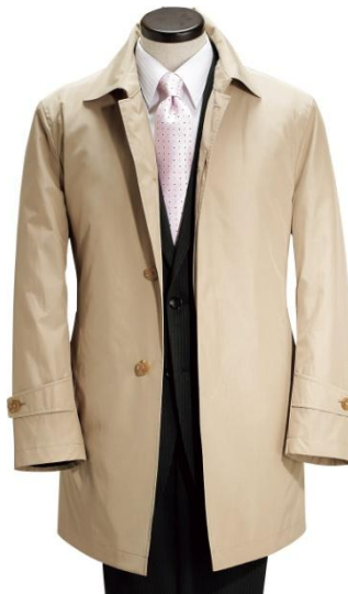
取り外し可能な ライナー付き

ブランド：INTIMAGE(インティメージ) 素 材：綿・ポリエステル 色：黒、グレー、ベージュ【写真】 サイズ：S～3L、BM～B3L(黒) S～LL(グレー、ベージュ) 価 格：39,800円