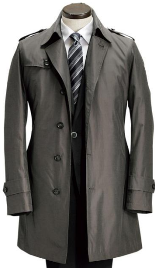
取り外し可能な ライナー付き

ブランド：LES MUES(レ ミュー) 素 材：綿・ポリエステル 色：黒、グレー【写真】、ベージュ サイズ：S～LL 価 格：39,800円(税込。以降、価格はすべて税込表記)