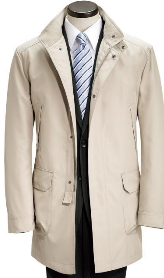
ウエストは調整可能な タブ付き

ブランド：INTIMAGE(インティメージ) 素 材：ポリエステル100% 色：黒、ベージュ【写真】 サイズ：S～LL 価 格：18,900円