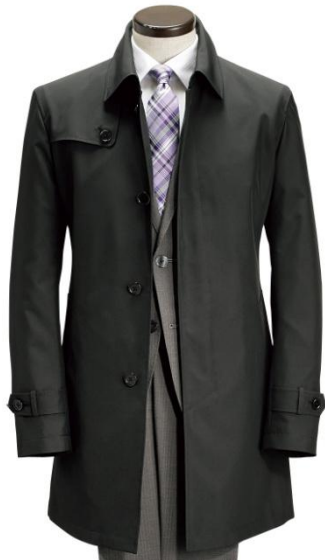
袖口は調整可能な タブ付き

ブランド：JOURNAL WORKS(ジャーナルワークス) 素 材：ポリエステル100% 色：黒 サイズ：S～LL 価 格：18,900円