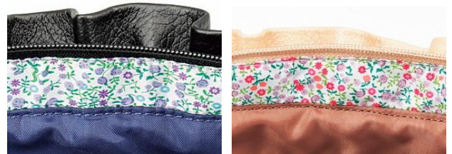
コートのライナーとお揃いのオリジナルフラワー柄