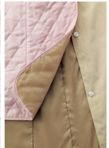
リバーシブルで無地にも