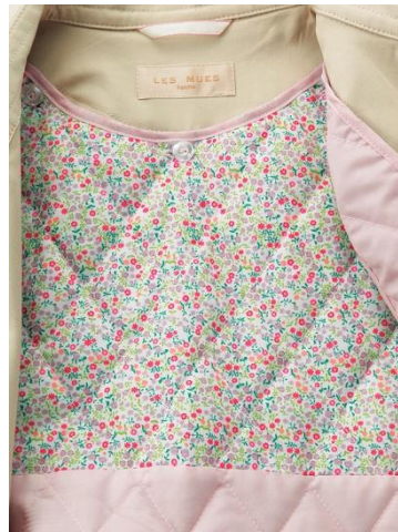
フラワー柄のライナー