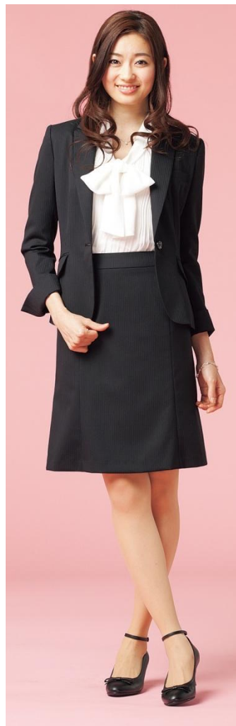
黒シャドーストライプ