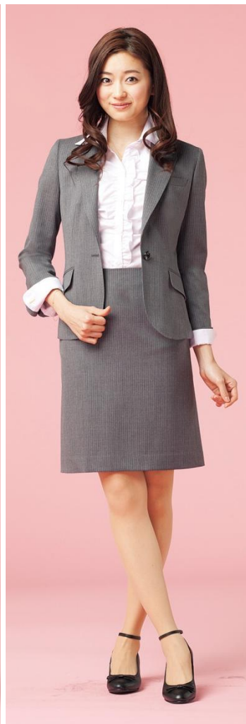
グレーストライプ