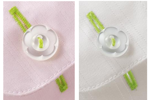
フラワー形のボタンとミントグリーンの色糸