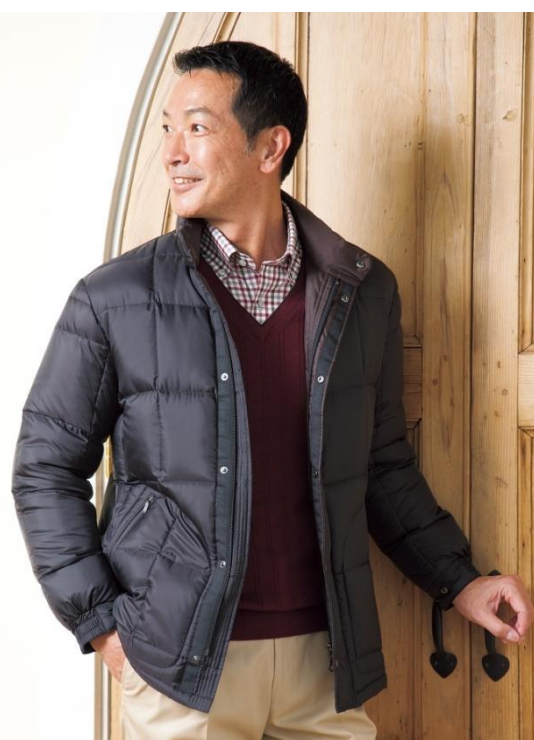
プレミアムスーパーライトダウンブルゾン

表地側の布を1枚省いたことで懸念されるダウンの吹き出しは、縫製の工夫でカバー。特殊な糸と先が細く鋭い針を用い、薄くて柔らかい生地でも針穴からダウンが吹き出しにくい仕様になりました。