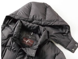
②着脱可能なフード