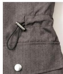
③ウエストのドロコード