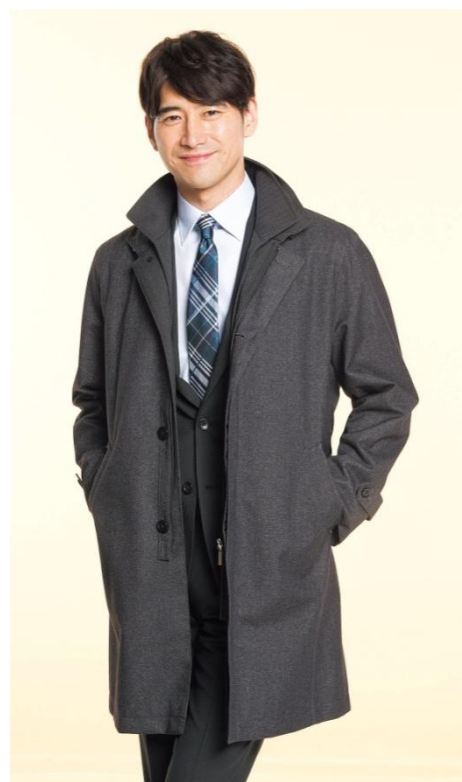
INTIMAGEのスタンドカラーコート(グレー)