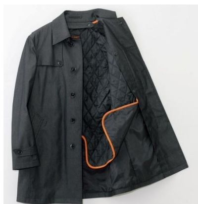
すべて吸湿発熱中綿を使用したライナー付き (写真はJOURNAL WORKS)