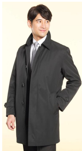
INTIMAGEのステンカラーコート(黒)