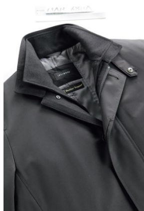
②レイヤードデザイン