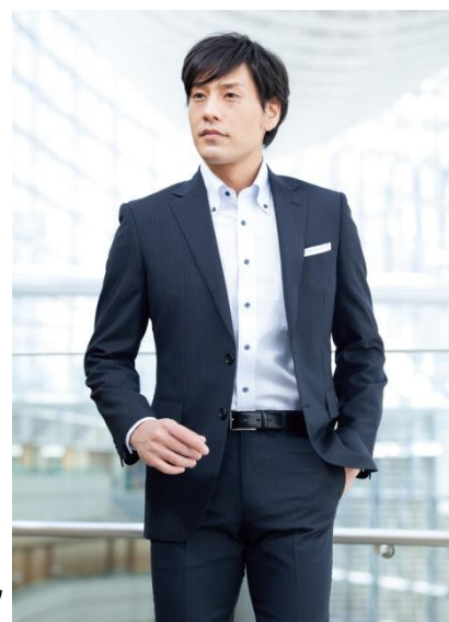
プレミアムライトスーツ

麻をブレンドした夏らしい商品も新たにラインアップ。麻特有のシャリ感を取り入れ、清涼感を演出しました。麻は、繊維が長く、ウールとブレンドしやすいラミーを採用しています。