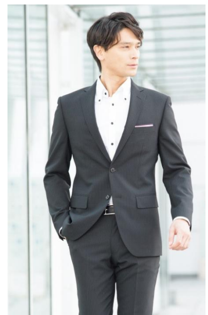
プレミアムウォッシュスーツ