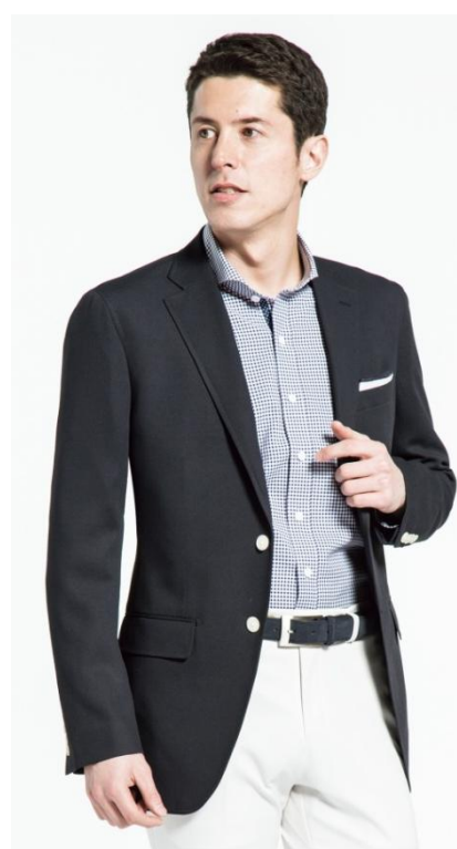
「BIZ-TECH®トラベラージャケット」

AOKIは、当商品をはじめ、これから迎えるクールビズに向け、機能性商品の訴求を強化してまいります。